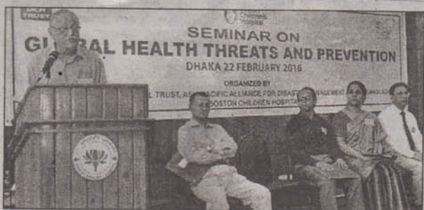
ঢাকা কমিউনিটি হাসপাতালে অনুষ্ঠিত বৈশ্বিক স্বাস্থ্য ঝুঁকি এবং প্রতিরোধবিষয়ক সেমিনারটি গতকাল আয়োজন করে এশিয়া প্যাসিফিক এলায়েন্স অব ডিজাস্টার ম্যানেজমেন্ট বাংলাদেশ, বোস্টন চিলড্রেন হাসপিটাল (ইউএসএ) ও ঢাকা কমিউনিটি হাসপাতাল ট্রাস্ট। বিজ্ঞপ্তি।